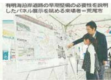
有明海沿岸道 早期整備を 期成会 荒尾市、長洲町でパネル展示

地域高規格道路（有明海沿岸道路）のⅡ期計画。国が佐賀、福岡県区間である大牟田市、福岡県区間（Ⅰ期、約55キロ）の早期整備を進め、熊本市（約30キロ）の早期整備に向けて、同一期整備している。熊本市のあらおシテイモーターは21日に荒尾市、荒尾市、長洲町職員がスタッフを務め、買い物客やイベント来場者にこの路線の重要性や利便性、熊本の地震からの復興を促進する道路であることもPRした。同道路（Ⅰ期）は、大牟田市から熊本市までの路線で、大牟田市の三池港IC（インターチェンジ）から長洲町までの計画段階評価が完了、2年半前に都市計画決定された。また、三池港IC供用開始後に発生した高潮浸水による通行止めの防止や災害発生時の機能確保に向け、三池港ICから荒尾競馬場跡付近までの約2・7キロの連絡路整備事業が2年前から行われている。会場ではパネル展示に加え、パンフレット150部ずつを配布。9月中旬に柳川市の徳益ICから柳川西ICまでの自動車専用区間（約4・5キロ）が開通したことで大牟田、みやま、柳川、大川の4市が自動車専用道路につながったことなどが紹介された。