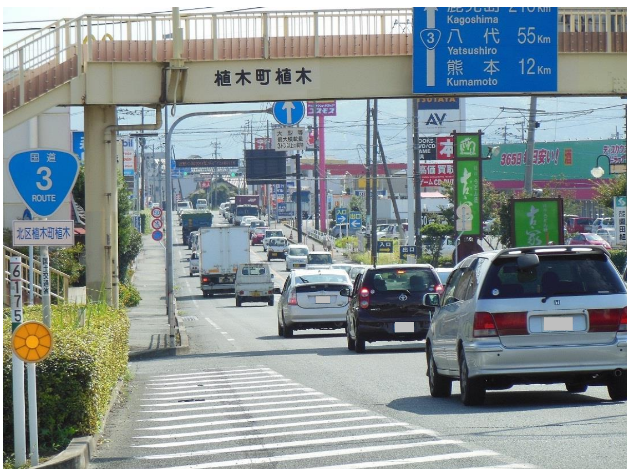
一般国道3号（熊本市北区役所付近）