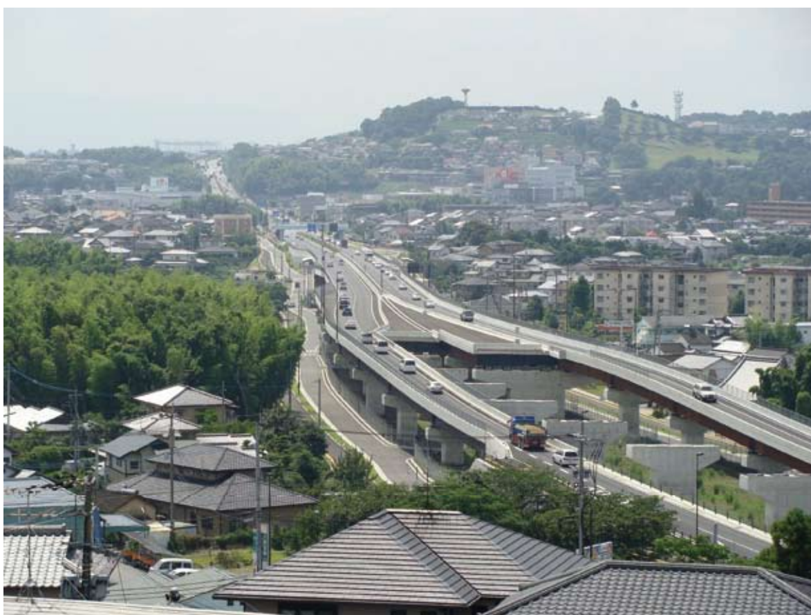
国道3号熊本北バイパス（合志市須屋付近）