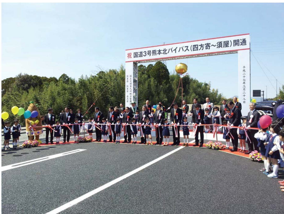
国道3号熊本北バイパス開通式（平成27年3月28日）