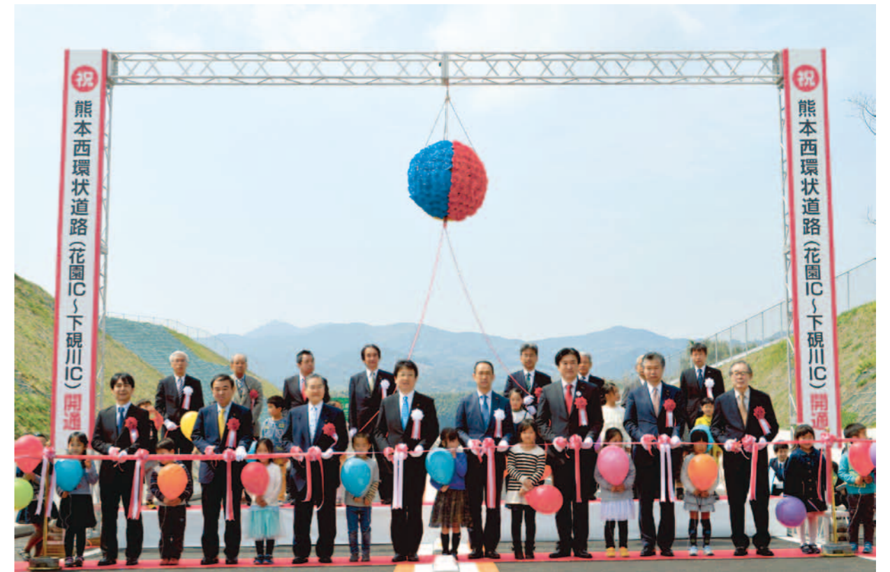
熊本西環状道路（花園IC～下硯川IC）開通式（H29.3.26）