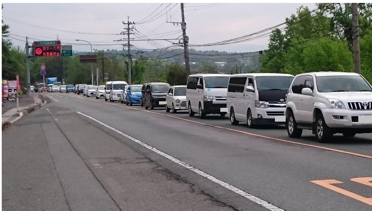
「平成28年熊本地震」直後の一般国道3号（植木IC付近）