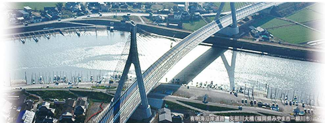
有明海沿岸道路 矢部川大橋 (福岡県みやま市-柳川市)