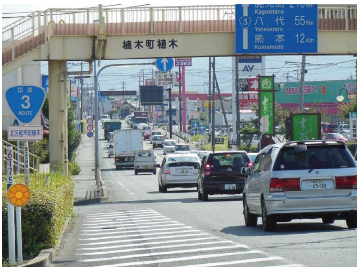
一般国道 3 号（熊本市北区役所付近）