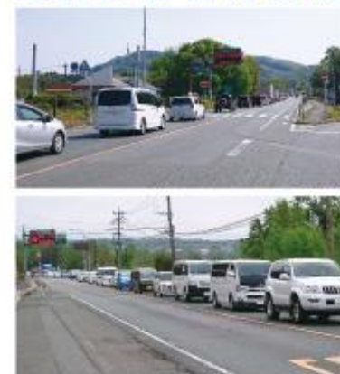
熊本地震直後の国道3号(植木IC付近)

● 熊本地震により、九州縦貫自動車道が被災寸断されたことにより、県北方面からの車両が国道3号に集中し、深刻な交通渋滞を引き起こしました。国道3号植木バイパスの整備により、災害時の代替ルートの確保など、災害に強い道路ネットワークの構築が期待されます。